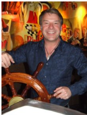
Patrick Lindner auf einer Kreuzfahrt im Mittelmeer

Das kommt natürlich ein wenig auf das Schiff bzw. die Grösse des Kreuzfahrtschiffs. Auf einem grossen Schiff, wie der MSC Opera im Juli bei der 18. Musi auf See ( https://www.blog-kreuzfahrt.ch/blog/kreuzfahrt-schnappchen/mit-patrick-lindner-nockalm-quintett-und-chuee-lee-durch-die-norwegischen-fjorde/ ) (Anmerkung: Ausser Patrick Lindner, sind noch das Nockalm Quintett, ChueeLee, die Fidelen Mölltaler mit ihrem Abschiedskonzert und andere Künstler an Bord und es hat noch einige wenige freie Kabinen) gibt es genügend Möglichkeiten sich seine Ecken zu suchen, damit man nicht dauernd "belästigt" wird. Allerdings habe ich persönlich überhaupt kein Problem mit dieser Art von "Belästigung". Ich gehe sehr offen mit meinem Publikum mit meinen Fans um. Und wenn ich mich mal zurückziehen, meine Privatsphäre geniessen möchte, so habe ich ja oft eine Balkonkabine und kann es mir auf dem Balkon gemütlich machen.